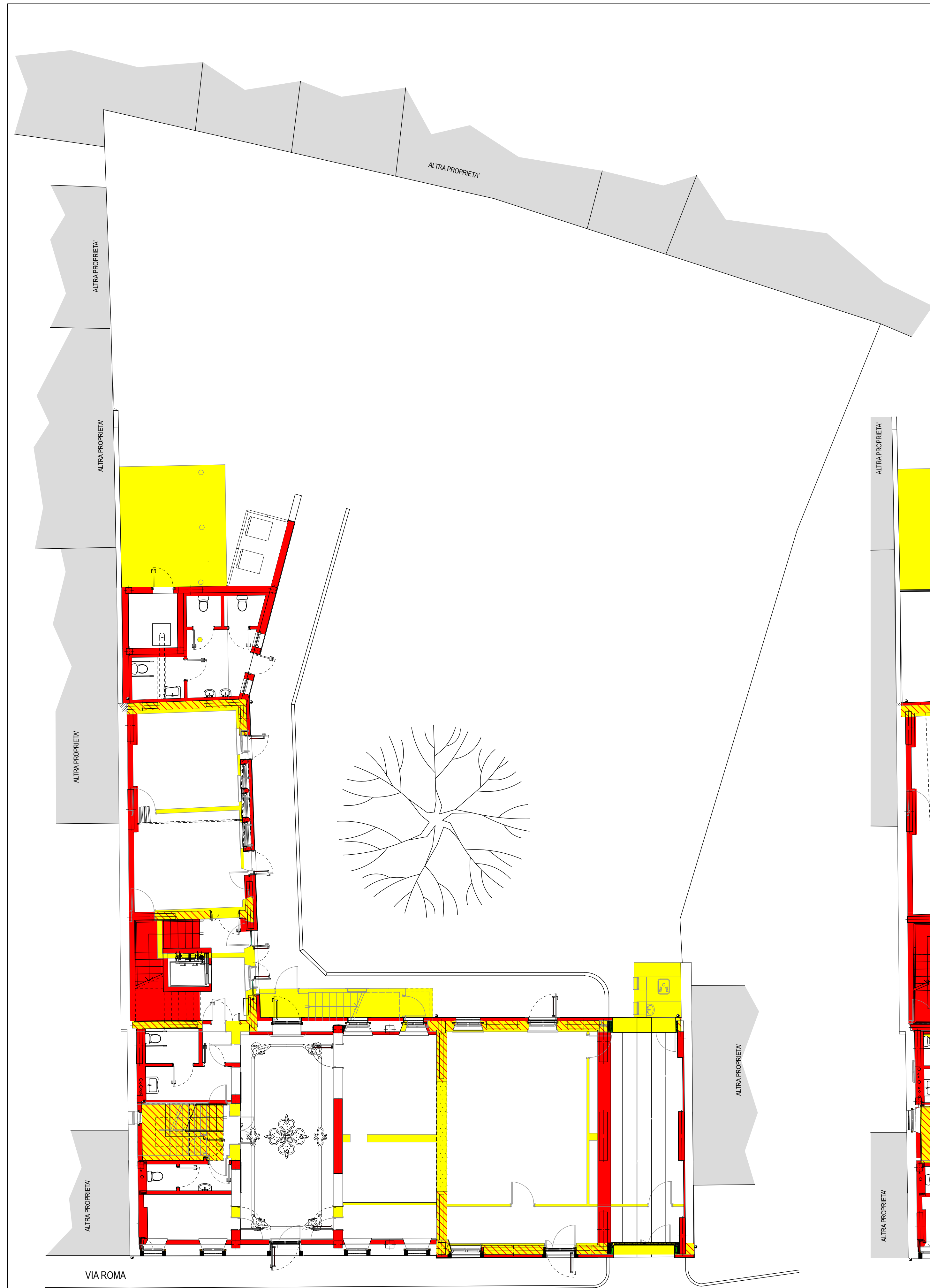
PIANTA PIANO TERRA Scala 1: 500