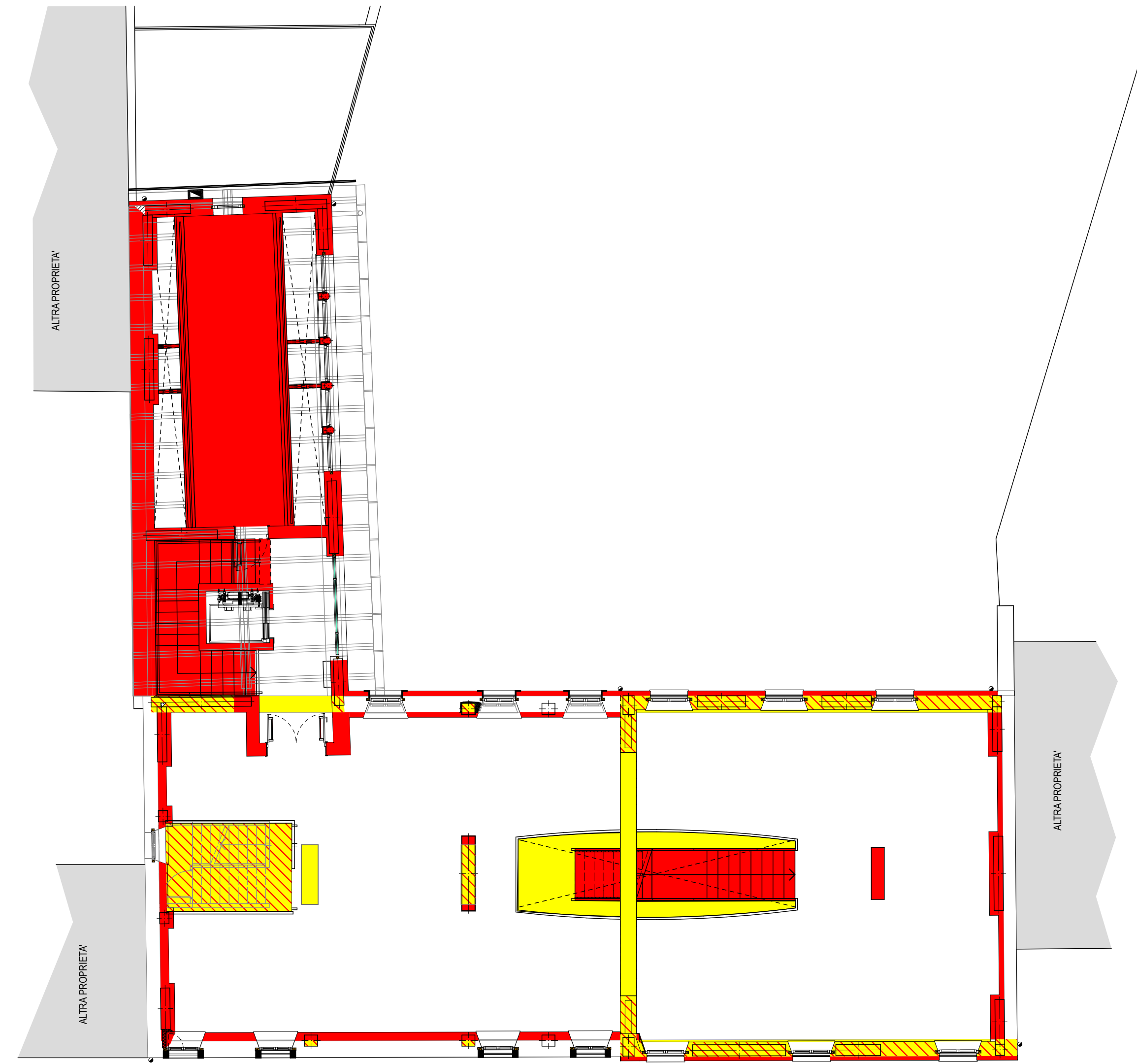
PIANTA PIANO SECONDO/SOTTOTETTO Scala 1: 100